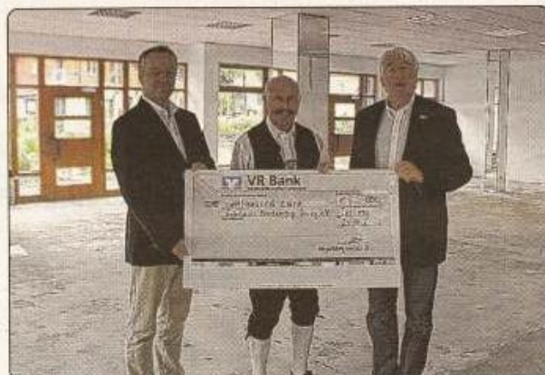
Scheckübergabe für das im August entstehende Begegnungszentrum.

Pflegende Angehörige sollen durch flexible Betreuungszeiten die Möglichkeit erhalten, entsprechend ihren Bedürfnissen